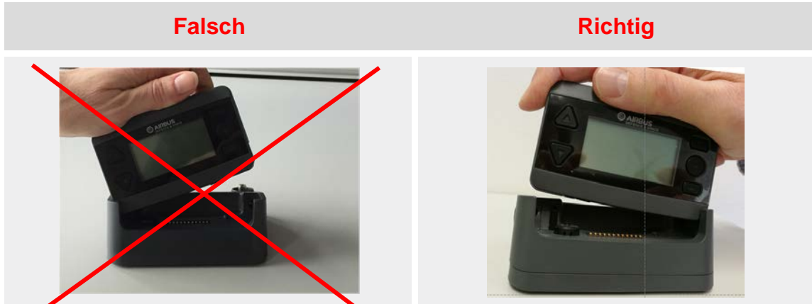
Abbildung 2: Einsetzen des Pagers in den Heimzusatz

Schritt 2: Der Pager soll möglichst gerade (waagerechte Position) in den Heimzusatz eingesetzt werden. Dann drücken Sie den Pager zum Einsetzen in den Heimzusatz vorsichtig von der rechten Seite in die Schale nach unten (im Bild zur Verdeutlichung übertrieben dargestellt). Wenn der Pager in den Verriegelungsmechanismus einrastet, sind zwei Klickgeräusche erst rechts, dann links zu hören.