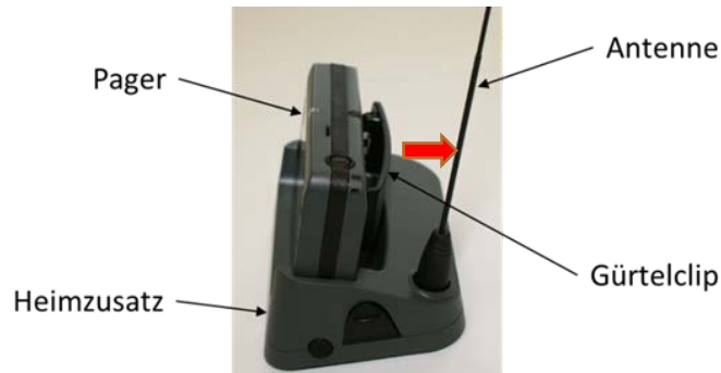
Abbildung 1: Pager im Heimzusatz

Schritt 1: Bevor Sie den Pager in den Heimzusatz einsetzen, halten Sie den Pager so, dass der Gürtelclip und Batterie in Richtung Antenne zeigen.