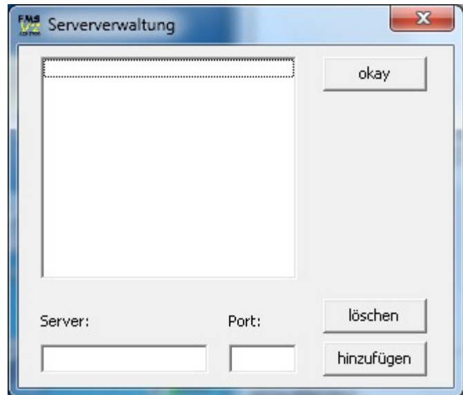
Abbildung 2: Serververwaltung

Achtung es wird nur das FMS32 Protokoll unterstützt! (Standardport 9300)