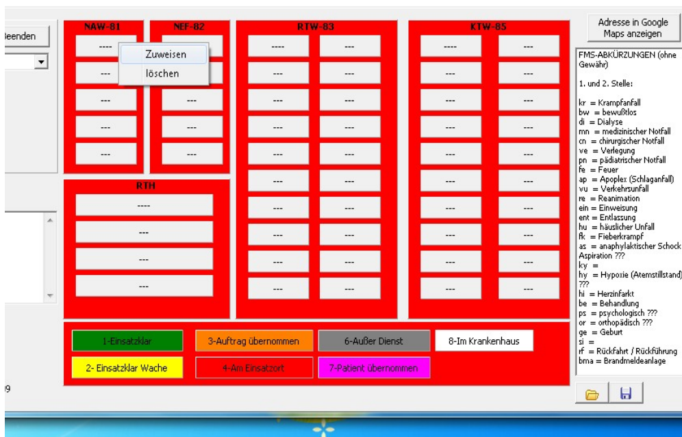
Abbildung 4: Kontextmenü

Im Verwaltungsmodus können alle Beschriftungen im rot markierten Bereiche geändert werden: Die Beschriftung der Gruppen durch links Klick auf den Text ( z.B.: NAW-81). Die Statusmeldungen durch anklicken der jeweiligen Farbigen Panel's. Die Fahrzeuge werden in den grauen Panel angezeigt und über das Kontextmenü (rechtsklick